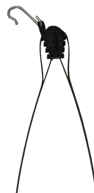
③ Elemento de tração