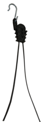
① Para fibra inteira